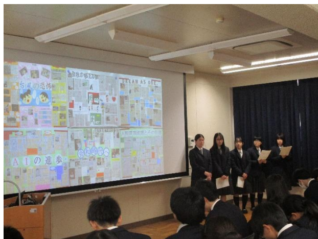
【ニュースを追え！講座の発表の様子】